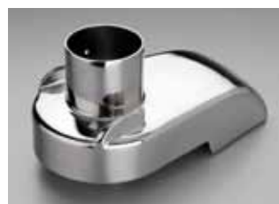
Deckel aus hochglanzpoliertem Edelstahl mit grossem 80 mm Rundschaft, für hohe Leistung.

Deckel, Saftauffangbehälter, Schleuderkorb und Reisscheibe sind aus rostfreiem Edelstahl, d.h. waschmaschinenfest. Die Reisscheibe ist im Schleuderkorb eingeschraubt und lässt sich bei Abnutzung leicht auswechseln.