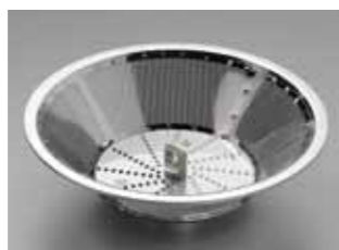
Robuster Schleuderkorb, komplett aus Edelstahl.